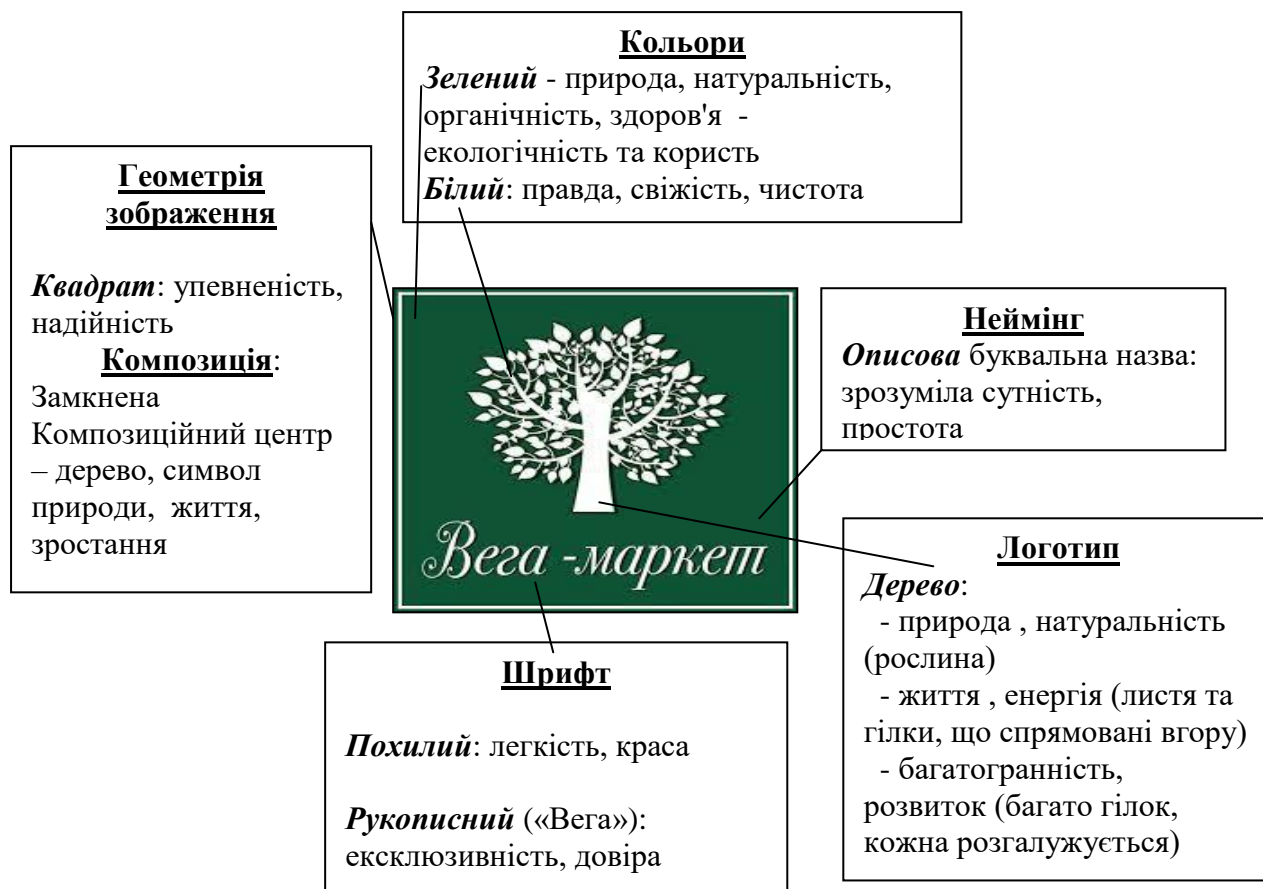
Рис. 2. Прийоми копірайтингу та візуалізації у фірмовому блоці магазину «Вега-маркет»

концепції. Магазини оформлені у зелених та білих кольорах, вітрини й стелажі зроблені під дерево, що підкреслює натуральність.