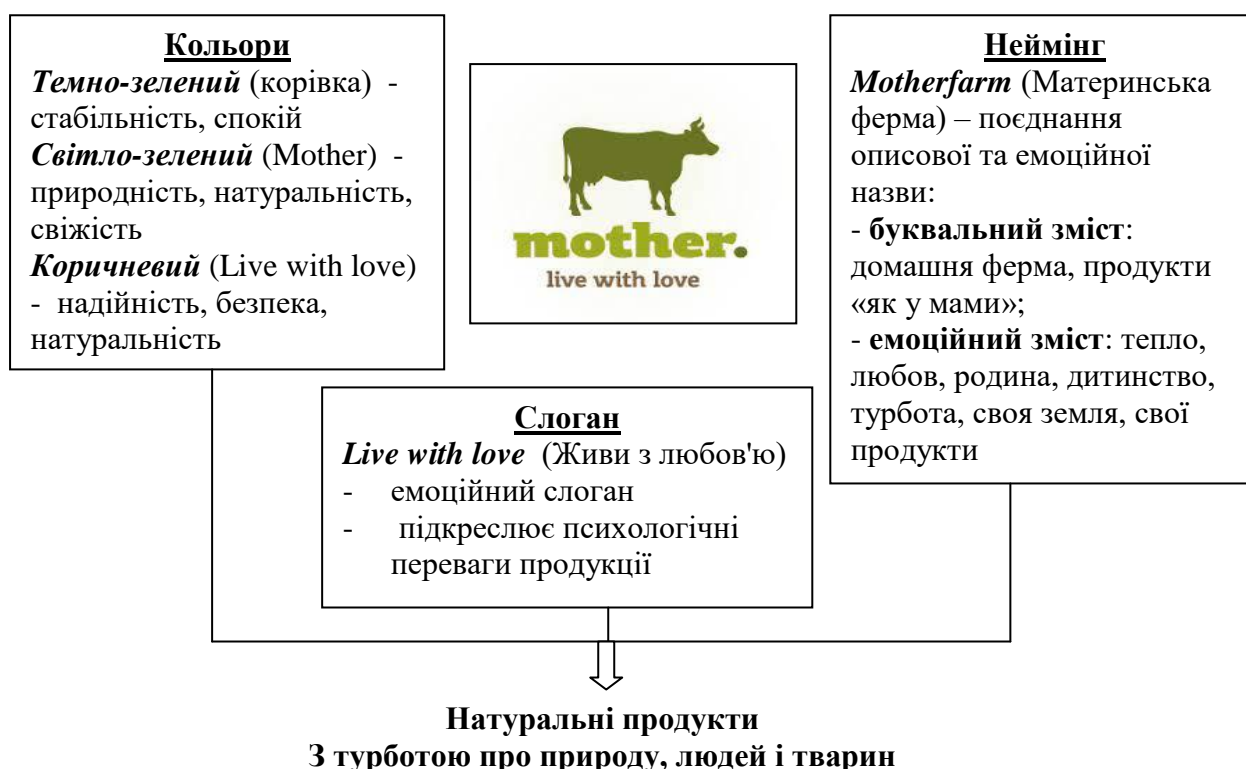
Рис. 3. Прийоми копірайтингу та візуалізації у фірмовому блоці екоферми «MotherFarm»

На рис. 3 поданий фірмовий блок MotherFarm із аналізом копірайтингу та візуальних аспектів.