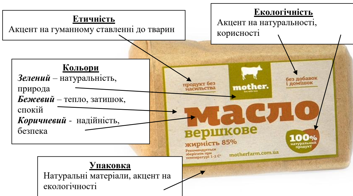
Рис. 4. Упаковка товару ТМ «MotherFarm» як джерело комунікацій із покупцем