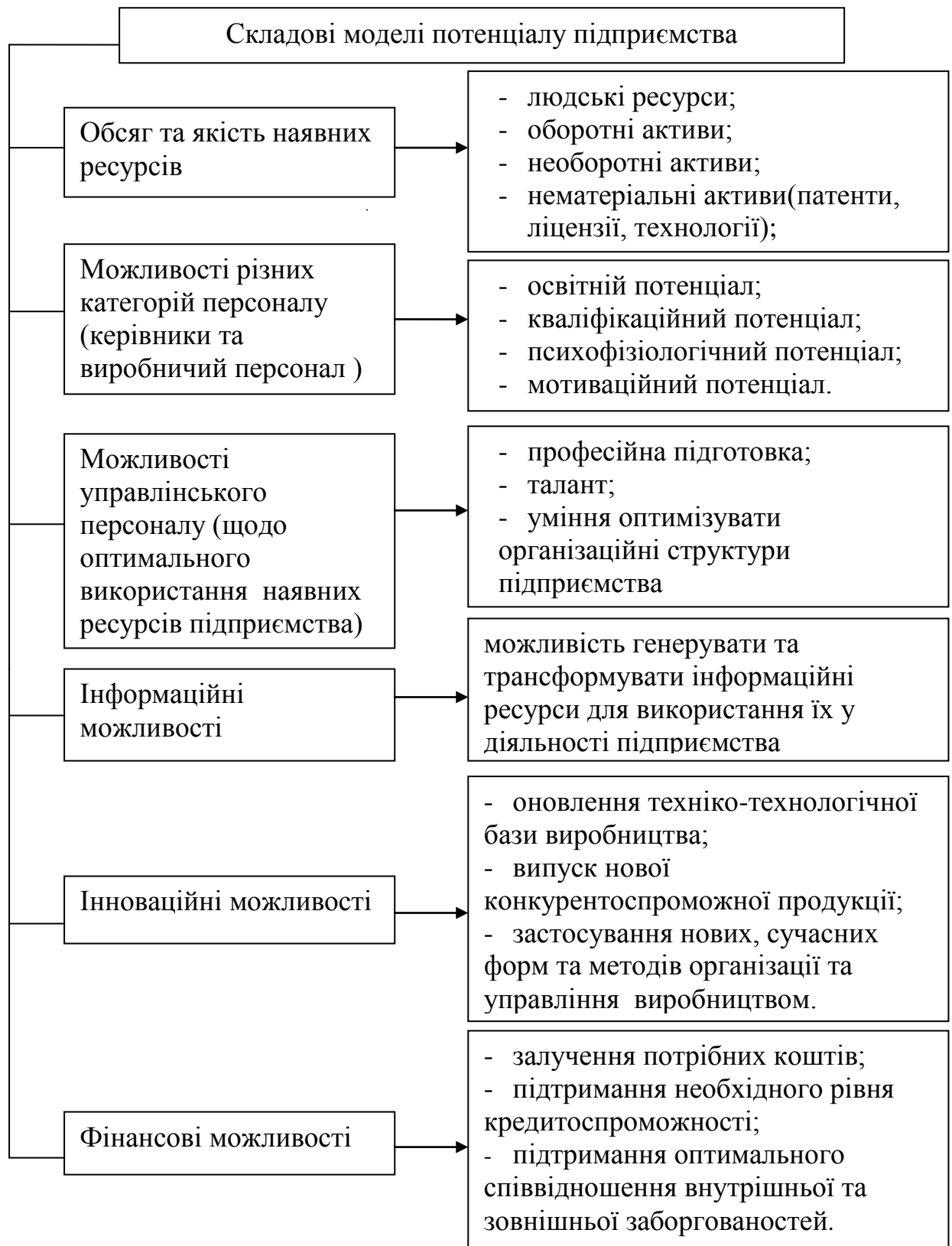
Рис. 2. Структура моделі економічного потенціалу підприємства

Всі елементи можуть функціонувати як одночасно, так і в сукупності. Взаємодія всіх складових потенціалу дозволяє досягти ефект цілісності