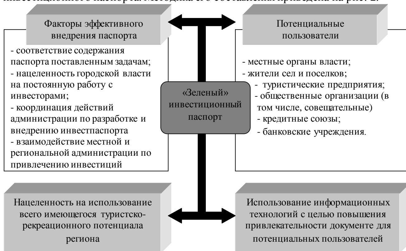
Рис. 2. Методические требования к разработке «зеленого» инвестиционного паспорта

Одним из инструментов повышения уровня привлекательности сельского зеленого туризма является разработка «зеленого» инвестиционного паспорта. Методика его составления приведена на рис. 2.