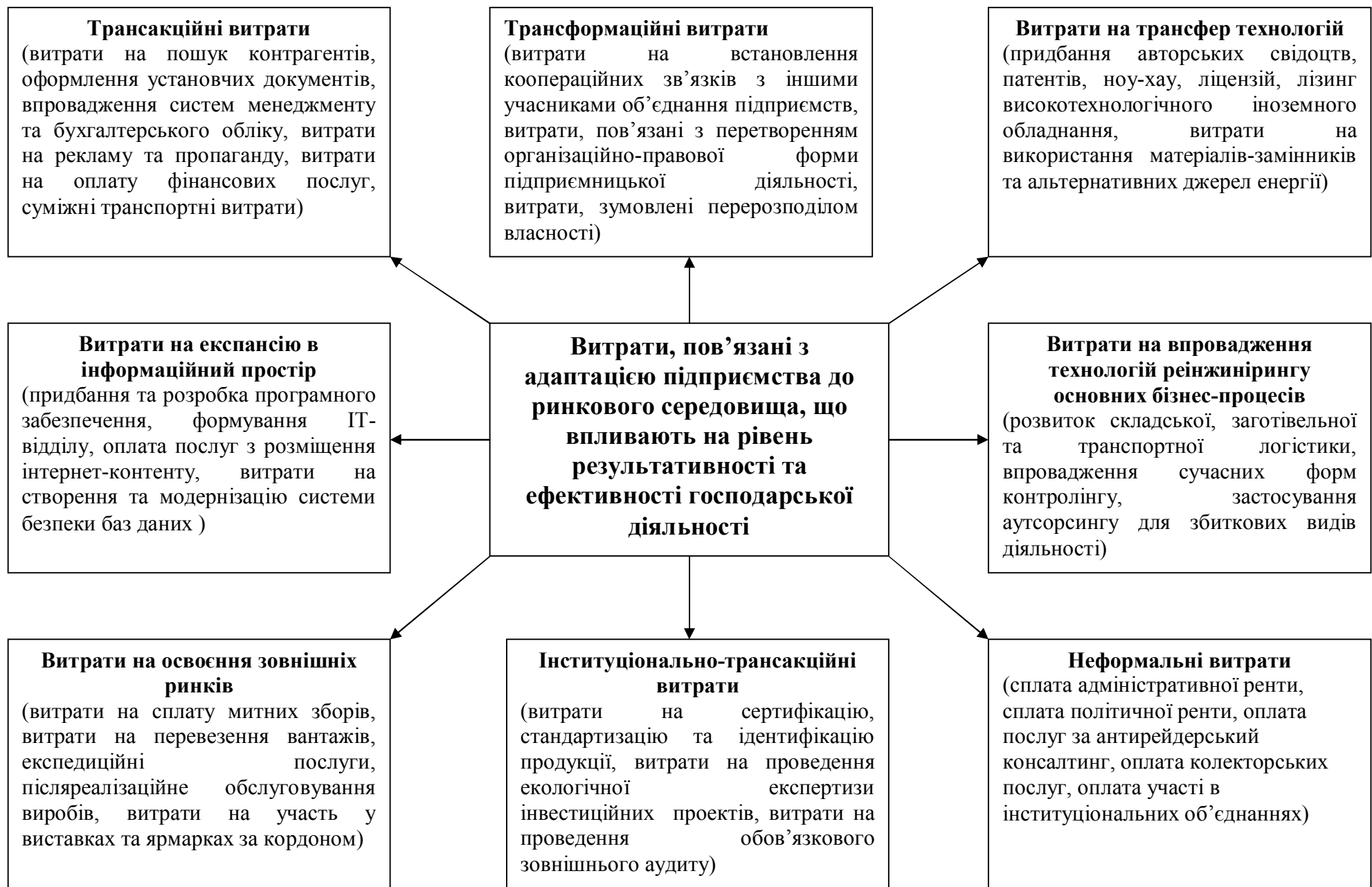
Рис. 1. Витрати, пов'язані з адаптацією підприємства до ринкового середовища, що впливають на рівень результативності та ефективності господарської діяльності