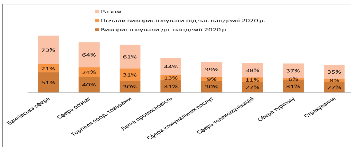
Рис.2. Динаміка впровадження цифрових технологій підприємствами в період пандемії

Більшість компаній банківської сфери, сфери розваг, страхування, телекомунікацій та інших вперше почали використовувати цифрові технології для надання послуг саме під час пандемії Covid-19. Динаміку впровадження цифрових технологій підприємствами різних сфер наведено на рис.2 [10].