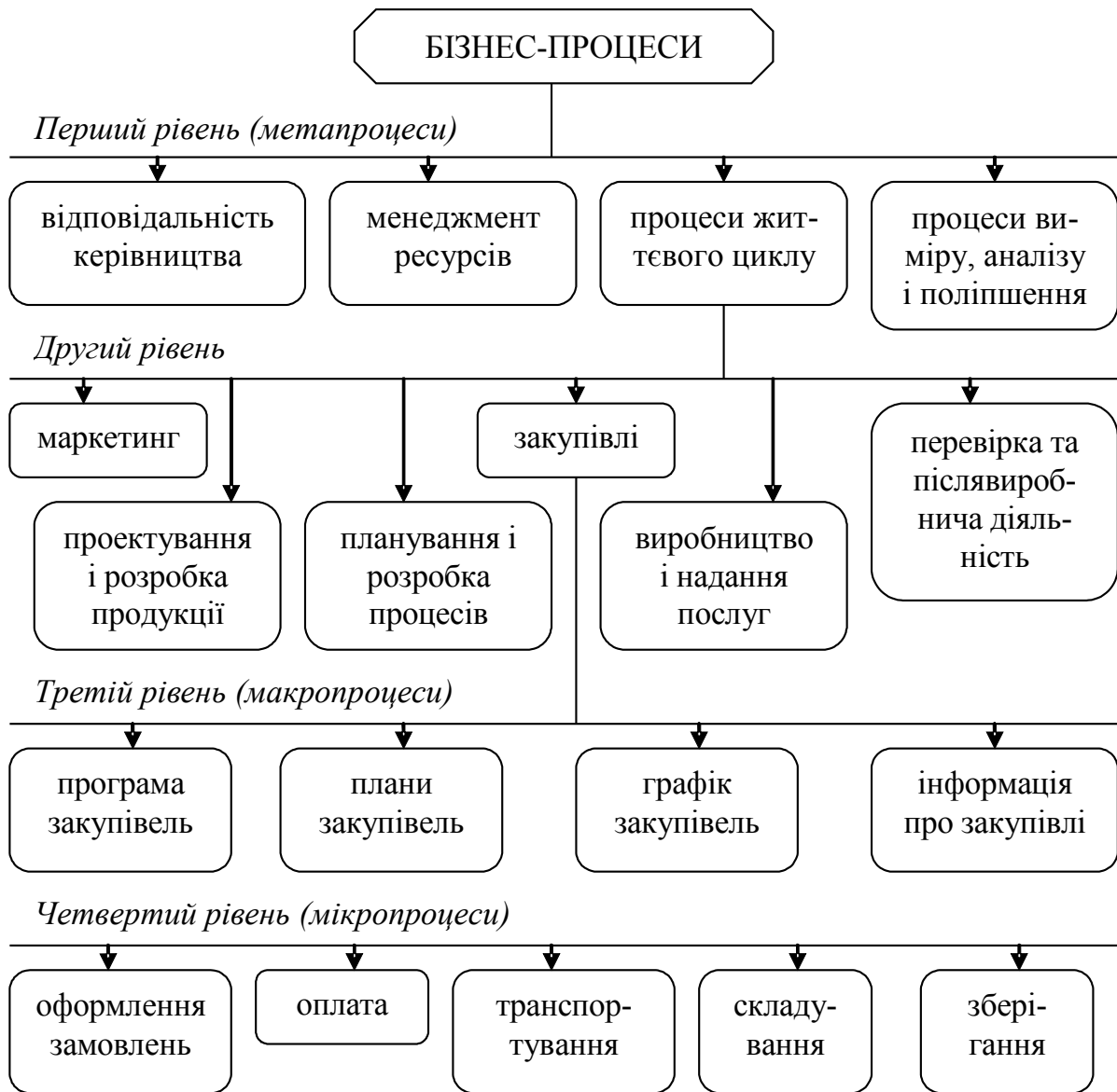
Рис. 3 Класифікація бізнес-процесів середнього промислового підприємства за рівнями значимості у системі управління якістю підприємства

Слід зазначити, що найбільш актуальною на сучасному етапі розвитку економічного середовища в умовах глобалізації є класифікація за призначенням (рис. 4).