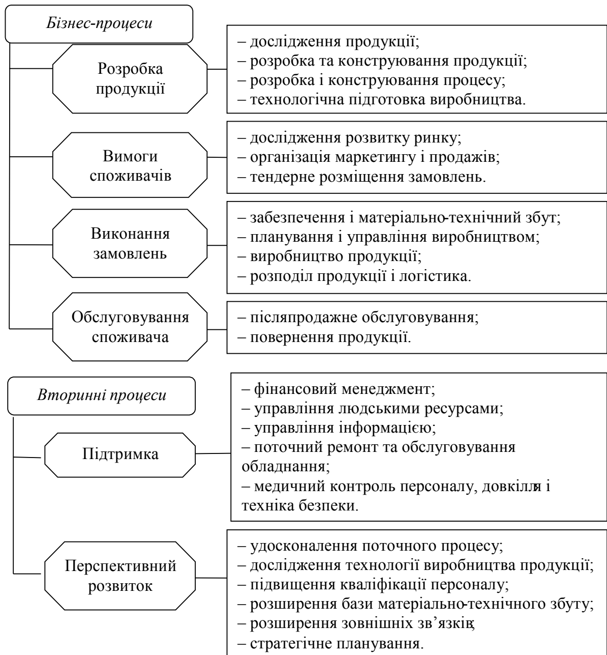
Рис. 2 Класифікація бізнес-процесів за ENAPS [1, с. 102]