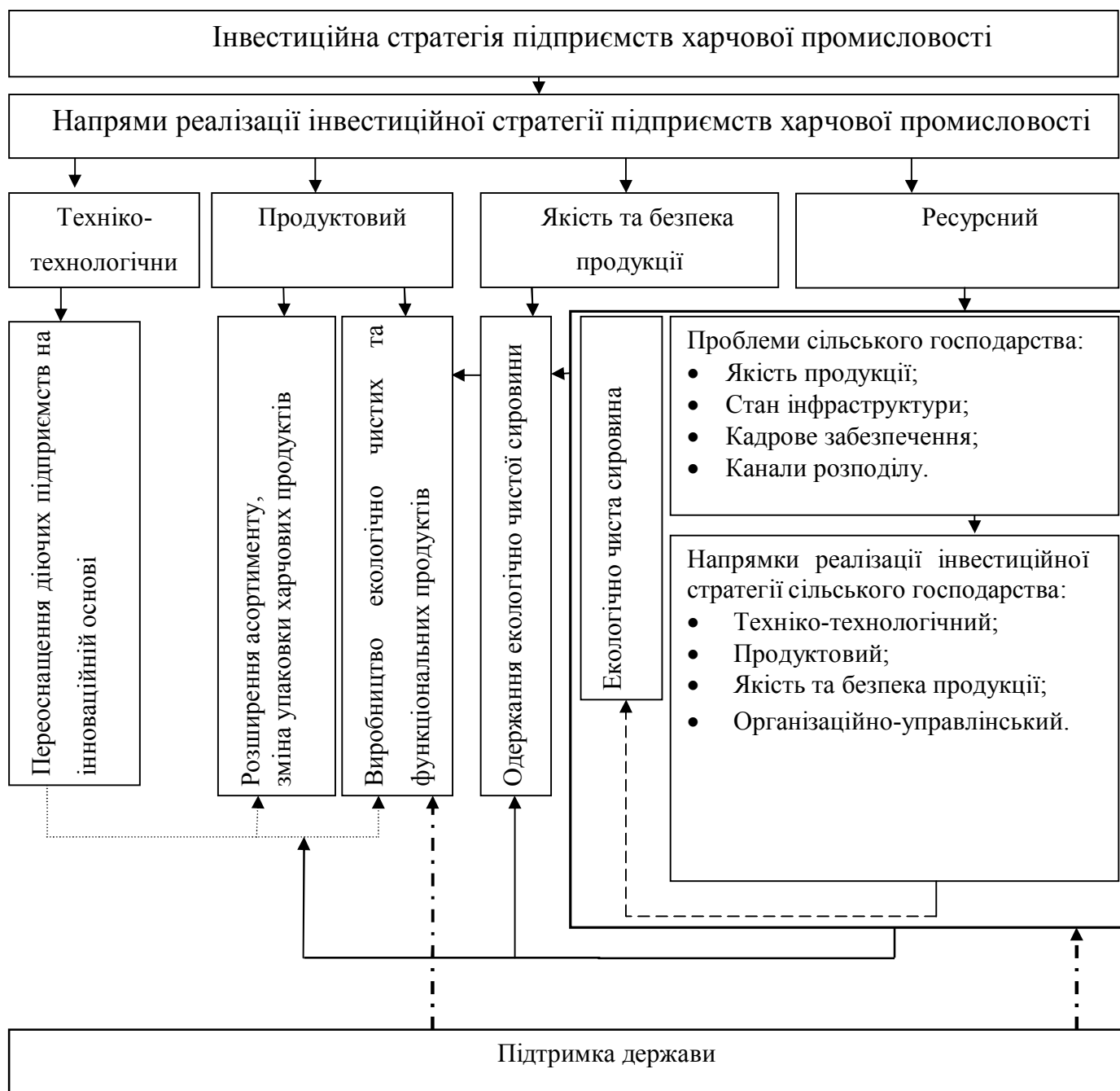
Рис. 4. Напрями інвестиційної стратегії

Для ефективного управління інвестиційною стратегією підприємства харчової галузі розроблено схему, яка охоплює всю низку взаємозалежних складових (рис. 5).