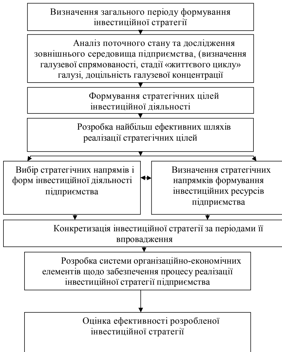
Рис. 1. Етапи розробки інвестиційної стратегії

Процес розробки інвестиційної стратегії включає етапи, що подані на рис. 1. Наведені послідовність і зміст основних етапів розробки інвестиційної стратегії підприємства в цілому відображають загальноприйняті в економічній теорії і практиці принципи і методичні підходи.