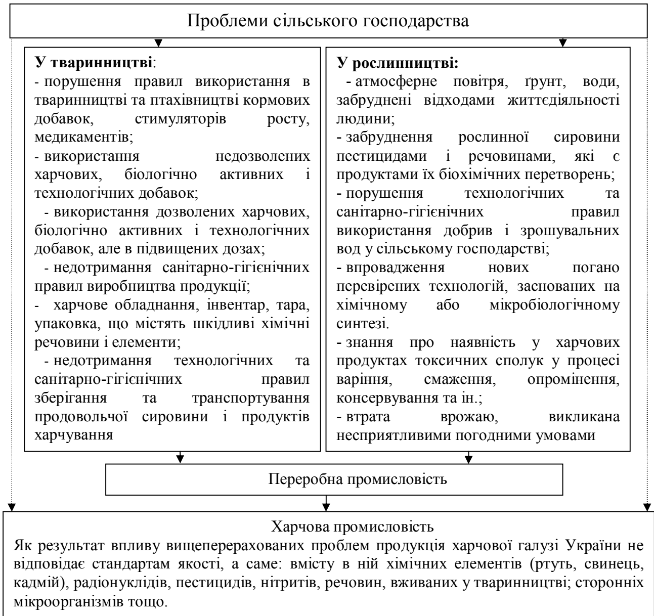
Рис. 2. Вплив сільського господарства на якість продукції харчової промисловості

Для виявлення першопричин цих негативних явищ на підприємствах харчової промисловості зображено зв'язки між основними проблемами сільськогосподарського виробництва та підприємств харчової промисловості (рис. 3). Основні проблеми сільського господарства породжують проблеми підприємств харчової промисловості України, вирішення яких є важливими напрямками для інвестиційного розвитку підприємств.