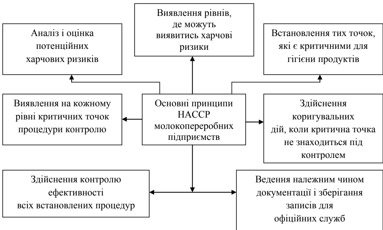
Рис. 2. Структура формування системи НАССР на молокопереробних підприємствах [11]

Впровадження цієї системи дає можливість підприємству стабільно виробляти молочну продукцію, яка відповідає встановленим характеристикам, гарантуючи її безпеку в процесі споживання. В кінцевому результаті знижуються збитки сільськогосподарських підприємств, пов'язані із внутрішніми (недоброякісна сировина, що не допущена до реалізації) і зовнішніми (повернення продукції) втратами. Разом з цим поліпшується реалізація молочної продукції, що безпосередньо пов'язано із збільшенням довіри до неї, екологічною безпекою для споживачів, а також з розширенням ринку збуту.