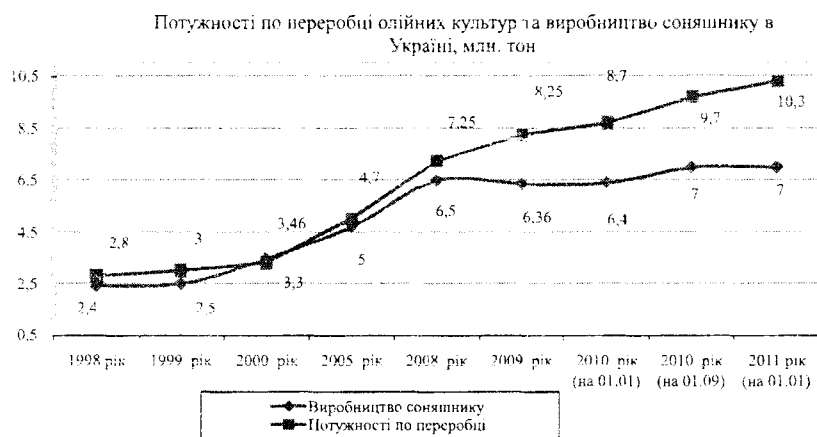
Рис. 2. Розвиток виробничих потужностей олійно-жирових підприємств та динаміка виробництва соняшнику в 1998-2010 роках 1

Виникає проблема забезпечення наявних потужностей по переробці необхідною кількістю сировини, особливо враховуючи тенденцію до вивозу сировини за кордон. На рисунку 2 видно, що темпи росту виробничих потужностей олійно-жирових підприємств випереджають темпи росту виробництва соняшника. У 2010/11 МР ціни на насіння соняшнику в Україні були найвищими за усі попередні маркетингові роки (див. Рис. 2).