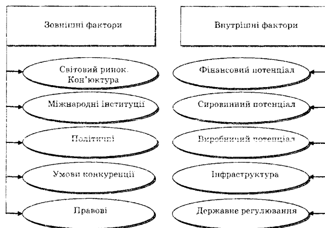
Рис. 1. Фактори формування експортного потенціалу

До основних внутрішніх факторів відносяться: