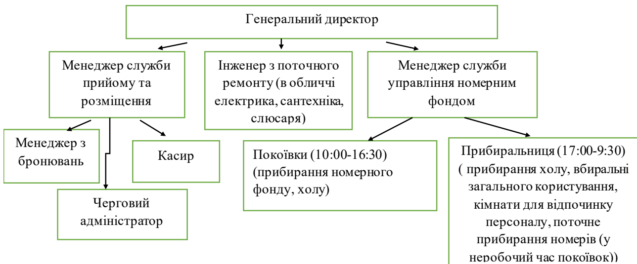
Рисунок 1 - Організаційно-функціональна структура готелю «Hermitage Boutique-Hotel»

Його організаційно-функціональною структурою є лінійний тип (рис.1).