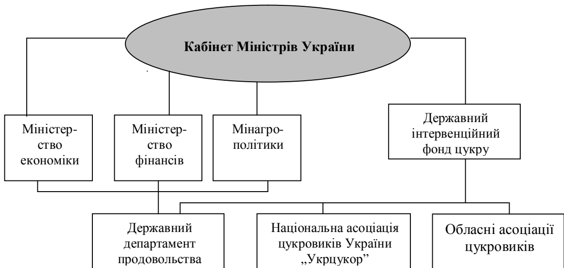
Рис. 4. Схема управління бурякоцукровим комплексом

В дисертаційному дослідженні розглянуті наслідки вступу нашої країни до СОТ для підприємств цукрової промисловості. При вступі України на загальних підставах, що передбачає беззастережне прийняття всіх вимог СОТ, прогноз являється песимістичним. Наслідками такого приєднання для цукрової промисловості стане стрімке усунення цукрового буряку з вітчизняного сировинного ринку та повне заміщення його імпортом білого цукру-сирцю, оскільки собівартість виробництва білого цукру з тростинного цукру-сирцю майже на третину менша, ніж бурякового. На сьогодні середня оптова ціна цукру на українському ринку становить 3600 грн./т, або 713 доларів США за курсом НБУ, що перевищує ціни на білий цукор у будь-якій країні світу. В результаті на звільнених землях замість цукрового буряку будуть вирощувати зернові культури і соняшник, рівень інтенсифікації виробництва яких досить високий, а світовий ринок мало насичений. Цукрові заводи будуть перепрофільовані на переробку цукру-сирцю. І як наслідок, наступить другий етап заміщення імпорту цукру-сирцю імпортом білого цукру. Результат - ліквідація української цукрової промисловості і абсолютна залежність від іноземного виробника цього продукту, що підтверджено розрахунками.