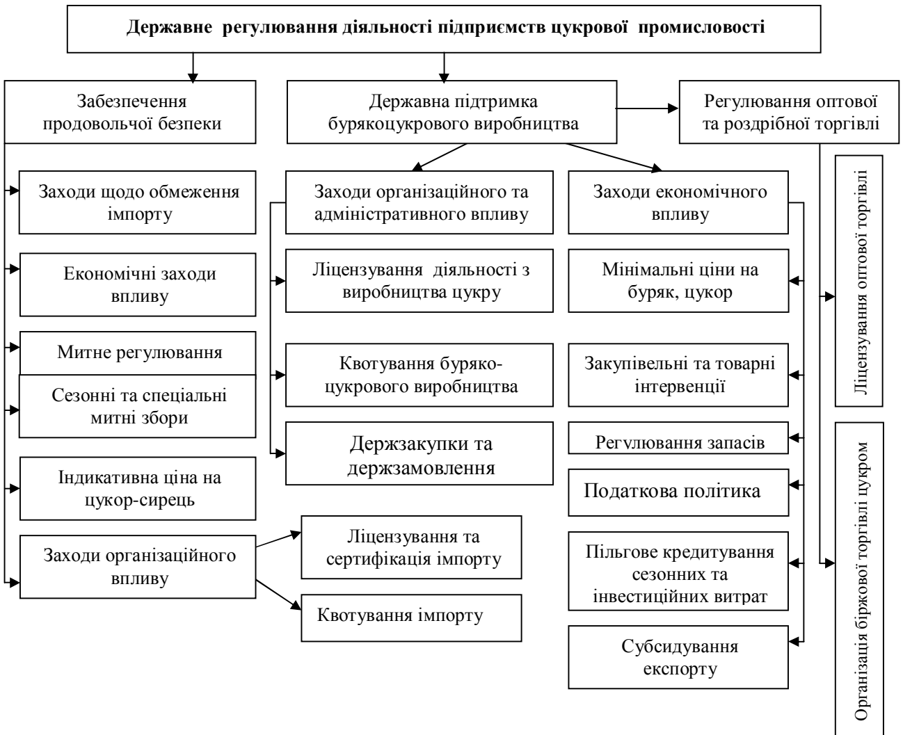
Рис. 3. Модель державного регулювання діяльності підприємств цукрової промисловості

Проведені дослідження дозволили встановити, що розвиток галузі не забезпечує досягнення необхідного рівня економічної ефективності, ефективності виробництва та ефективності захисних заходів держави, а підвищити ефективність функціонування підприємств цукрової промисловості можна тільки в умовах сполучення гнучкої системи державного регулювання з механізмами ринкової економіки. На наш погляд, ці механізми повинні включати систему заходів державного захисту та підтримки вітчизняних виробників і створювати цивілізовані «правила гри» для всіх учасників ринку, включаючи його інфраструктуру. Нами розроблена модель державного регулювання діяльності підприємств цукрової промисловості, яка наведена рис. 3.