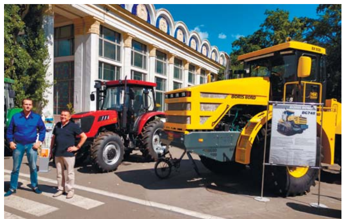
Рис. 3 – Трактор «Boris Bond 958I»

У рамках спеціалізованої виставки «Organik» (органічна продукція) вітчизняна компанія «БТУ-Центр» представляла мікробні і ферментні препарати для сільського господарства (рис. 4). Серед їхньої продукції – лінійки для захисту та живлення рослин, оздоровлення ґрунтів, біопрепарати для тваринництва та ін.