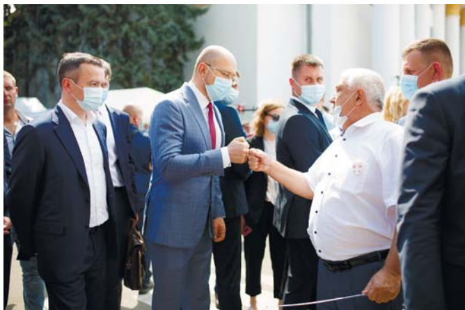
Рис. 5 – Відвідування експозиції УкрНДІПВТ ім. Л. Погорілого Прем'єр-Міністром України Денисом Шмигалем

Експозицію відвідали Прем'єр-міністр України Денис Шмигаль (рис. 5) та Міністр розвитку економіки, торгівлі та сільськогосподарства України Ігор Петрашко, заступник міністра розвитку економіки, торгівлі та сільськогосподарства з питань агрополітики Тарас Висоцький та інші відповідальні працівники Мінекономіки та інших міністерств і відомств України.