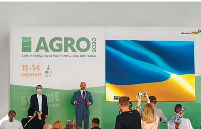
Рис. 1 – Офіційне відкриття виставки за участі Дениса Шмигала

Вступ. Офіційне відкриття виставки відбулося 4 червня о 12:00 за участю Прем'єр-Міністра України Дениса Шмигала (рис. 1)