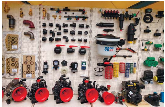
Рис. 7 – Експозиція «Бондіолі і Павезі» на виставці «АГРО-2020»

Компанія «Бондіолі і Павезі» є одним із провідних виробників комплектувальних та представляла відвідувачам виставки «АГРО-2020» приводні вали, редуктори, теплообмінники, аксіально-поршневі та шестеренні насоси і мотори, сервоприводи, розпилювачі до обприскувачів та багато інших компонентів (рис. 7).