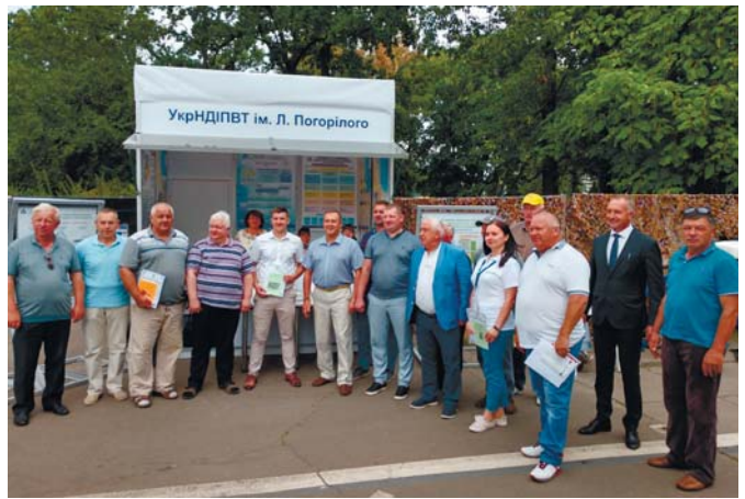
Рис. 6 – Урочисте вручення Реєстраційних посвідчень на експозиції УкрНДІПВТ ім. Л. Погорілого

Представникам заводів сільськогосподарського машинобудування, техніка яких пройшла випробування з метою внесення її до Державного реєстру технічних засобів для АПК, було вручено 31 Реєстраційне посвідчення (рис. 6).