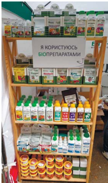
Рис. 4 – Продукція компанії «БТУ-Центр» на виставці «АГРО-2020»

Учасниками експозиції в складі першої рубрики були 9 підприємств вітчизняного сільськогосподарського машинобудування.