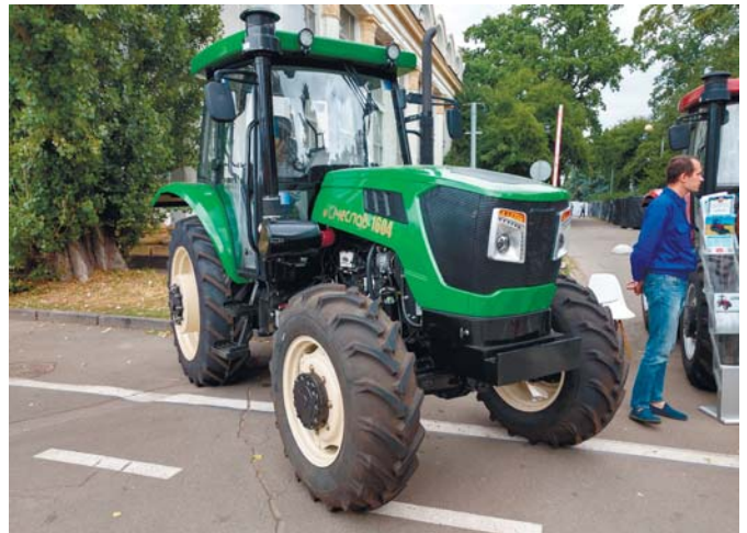
Рис. 2 – Трактор «Січеслав 1604»

© Муха В., Пономаренко О., Куянов В., Миропольський О. 2020