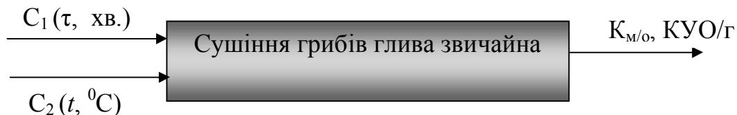
Рисунок 1 – Параметрична модель процесу сушіння грибів глива

Параметрична модель процесу сушіння грибів глива звичайна представлена на рисунку 1.