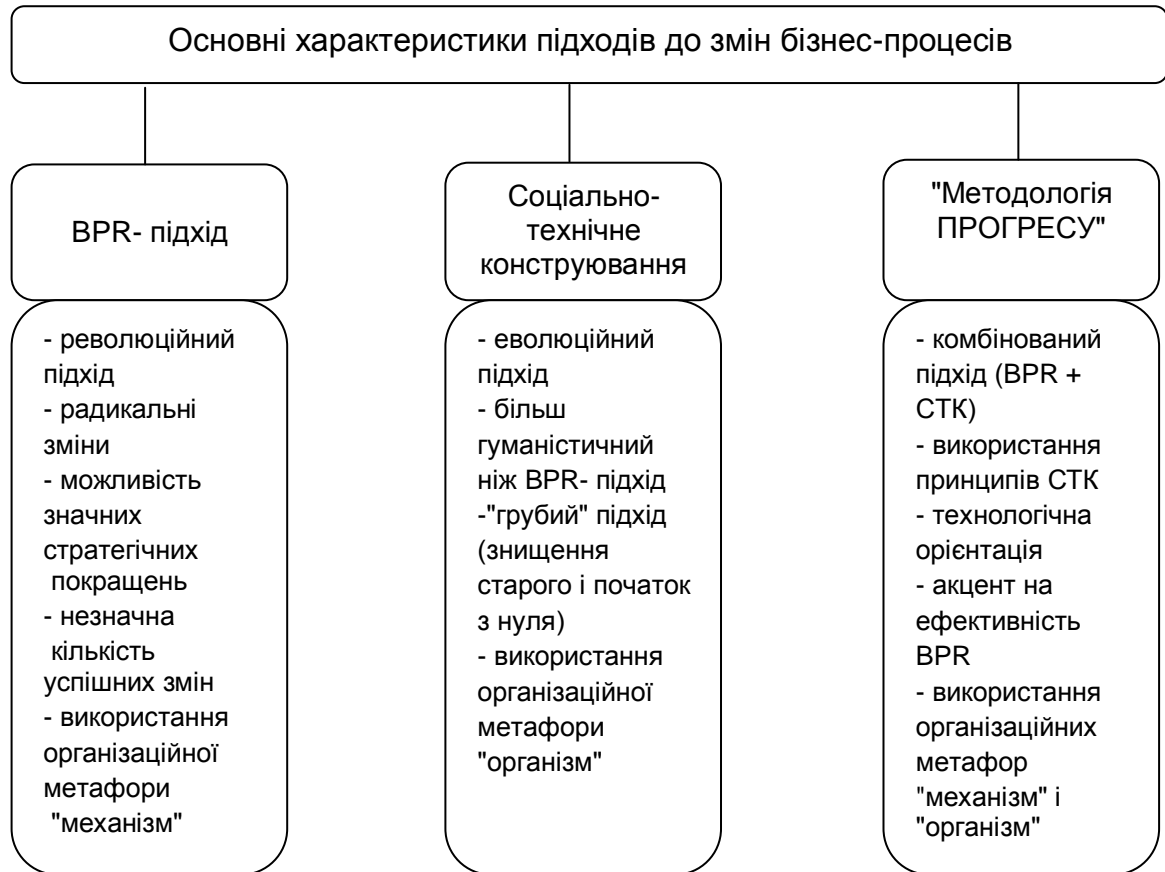
Рисунок 1. Порівняльні характеристики підходів до змін бізнес-процесів [узагальнено автором за джерелами 4, 6, 7]

На підставі вище розглянутої сутності трьох підходів можна подати їх узагальнюючі порівняльні характеристики (рис. 1).