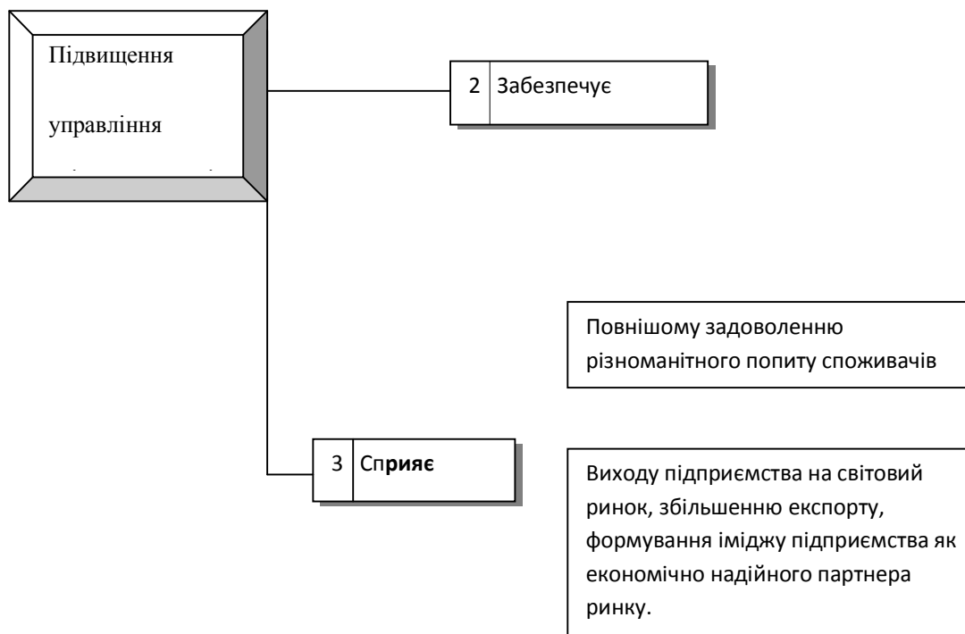
Рис.1. Багатоспрямований вплив підвищення якості продукції на виробництво та імідж підприємства.

Необхідно відмітити, що важливим етапом на підприємстві під час процесу формування шляхів удосконалення управління якістю продукції є планування .