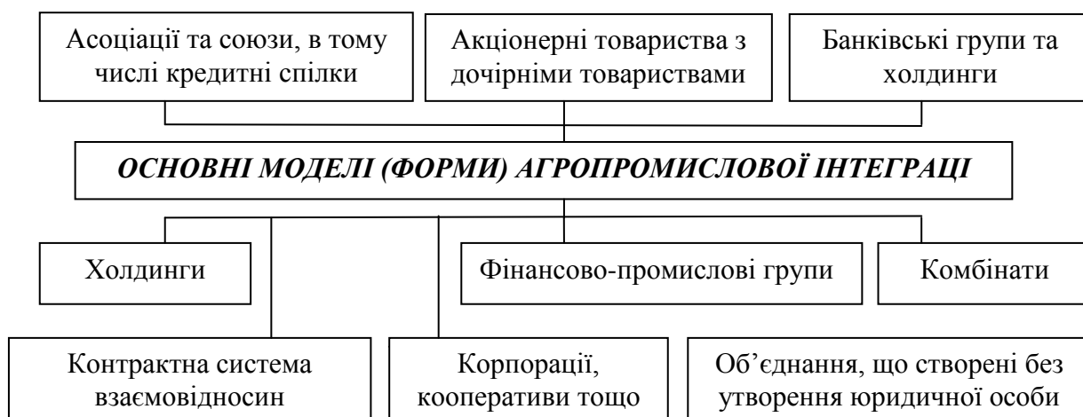
Рис.2. Моделі агропромислової інтеграції

Розглядаючи сутність представлених моделей можна зазначити, що модель агропромислової інтеграції у вигляді контрактної системи передбачає вивчення взаємовідносин сільгоспвиробників із переробними, збутовими та іншими підприємствами АПК. Об'єднання, створені без утворення юридичної особи мають бути очолені фірмою-інтегратором, яка повинна здійснювати зв'язки з іншими учасниками об'єднання на контрактній основі або шляхом участі у формуванні їх власності. Ведучою стороною та інвестором при цьому виступає несільськогосподарське підприємство.